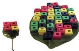
Gambar 6. Memperkirakan Jumlah Benda yang Digunakan untuk Menutupi Permukaan Daun in the number coloring games.

Anak (siswa kelas rendah) diharapkan dapat memiliki kemampuan memperkirakan (estimasi) sesuatu misalnya perkiraan terhadap waktu, luas jumlah ataupun ruang. Selain itu siswa terlatih untuk mengantisipasi berbagai kemungkinan yang akan dihadapi.