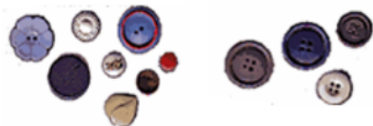
Gambar 3 : Mengelompokkan Kancing yang Berlobang 4 dan yang tidak berlobang 4 in the number coloring games

Anak (siswa kelas rendah) 11 diharapkan dapat mengelompokkan atau memilih benda berdasarkan jenis, fungsi, warna, bentuk pasangannya sesuai dengan yang dicontohkan dan tugas yang diberikan oleh guru. Untuk lebih jelasnya terlihat dalam contoh berikut.