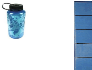
Gambar 5 : Mengukur Tinggi Botol dengan Alat Ukur Balok