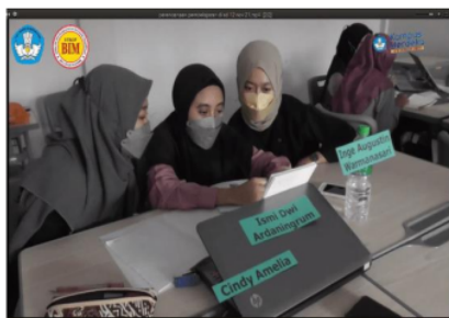
Gambar 6 : Kegiatan Kolaborasi Kelompok 1 pada siklus 2 pada saat mengerjakan LKM

Adapun aspek yang dinilai berdasarkan indikator keterampilan kolaborasi yang sudah dimodifikasi menurut (Widiyoko, 2012) diantaranya: 1) berkontribusi aktif, 2) bekerja produktif, 3) menunjukkan fleksibilitas/kompromi, 4) bertanggung jawab, dan 5) menunjukkan sikap menghargai. Adapun hasil keterampilan kolaborasi mahasiswa ditunjukkan pada tabel 4.