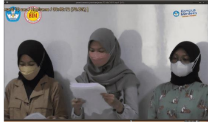
Gambar 3: Kegiatan dalam mengomunikasikan hasil kerja pada siklus 1

keterampilan komunikasi dapat dilihat saat mahasiswa mempresentasikan hasil LKM pada gambar 2 di bawah ini: