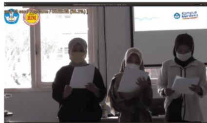
Gambar 4: Kegiatan dalam mengomunikasikan hasil kerja pada siklus 2

Aspek yang dinilai berdasarkan indikator komunikasi yang sudah dimodifikasi menurut (Muhammad, 2011) diantaranya: 1) keterbukaan; 2) empati; 3) fokus; 4) dan berbicara dengan jelas. Adapun hasil keterampilan komunikasi mahasiswa dapat dilihat pada tabel 3.