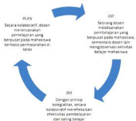
Gambar 2. Bentuk Siklus Lesson Study (Melati et al., 2014)

komunikasi mahasiswa PGSD dengan menerapkan model pembelajaran PBL berbasis lesson study (LS). Penelitian ini berlangsung dalam 2 kali siklus. Tahapan pelaksanaan LS ini merujuk pada buku penyaluran hibah Lesson Study untuk LPTK. Pelaksanaan LS dalam bentuk siklus dengan 3 tahapan yakni plan , do , dan see yang akan disajikan pada gambar berikut ini;