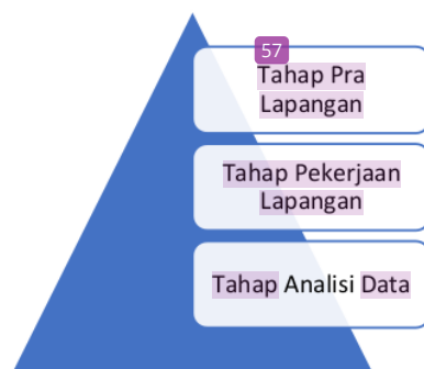
Gambar 1. Tahapan penelitian

Penelitian ini menggunakan pendekatan kualitatif. Sementara itu karakteristik yang digunakan dalam penelitian ini adalah deskriptif. Menurut (Moleong, 2010) penelitian kualitatif adalah penelitian yang bermaksud untuk memahami fenomena tentang apa yang dialami oleh subjek penelitian misalnya perilaku, persepsi, motivasi, tindakan dan lain – lain secara holistik dan dengan cara deskripsi dalam bentuk kata – kata dan bahasa, pada suatu konteks khusus yang alamiah dan dengan memanfaatkan berbagai metode alamiah.