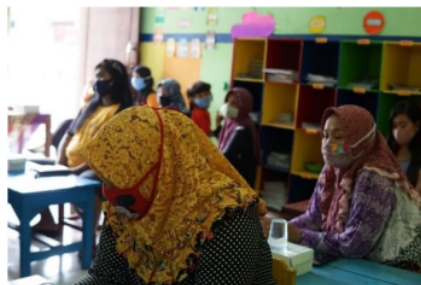
Gambar 2. Walimurid TK Dharmawanita Gedangan

Berdasarkan tata bahasanya, menurut Adawiah (2017) pola asuh terdiri dari kata pola dan asuh. Menurut Kamus Umum Bahasa Indonesia, kata pola berarti