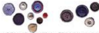
Gambar 3 : Mengelompokkan Kancing yang Berlobang 4 dan yang tidak berlobang 4 in the number coloring games

Anak (siswa kelas rendah) diharapkan dapat mengelompokkan atau memilih benda berdasarkan jenis, fungsi, warna, bentuk pasangannya sesuai dengan yang dicontohkan dan tugas yang diberikan oleh guru. Untuk lebih jelasnya terlihat dalam contoh berikut.