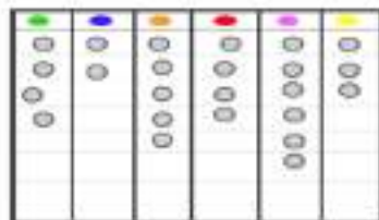
Gambar 7 : Membuat grafik "Warna Kesukaanku" in the number coloring games

Siswa di kelas rendah pada Sekolah Dasar diharapkan dapat memiliki kemampuan untuk memahami perbedaan-perbedaan dalam jumlah dan perbandingan dari hasil pengamatan terhadap suatu objek (dalam bentuk visual). Contohnya adalah sebagai berikut :