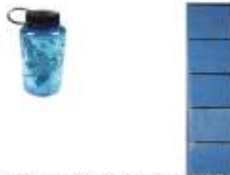
Gambar 5 : Mengukur Tinggi Botol dengan Alat Ukur Balok