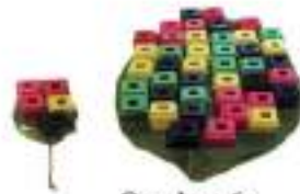
Gambar 6. Memperkirakan Jumlah Benda yang Digunakan untuk Menutupi Permukaan Daun in the number coloring games .

Anak (siswa kelas rendah) diharapkan dapat memiliki kemampuan memperkirakan (estimasi) sesuatu misalnya perkiraan terhadap waktu, luas jumlah ataupun ruang. Selain itu siswa terlatih untuk mengantisipasi berbagai kemungkinan yang akan dihadapi.